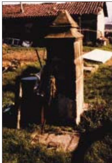
Antiguo pozo dentro del monasterio. (Autor: José Ramón Tojal)