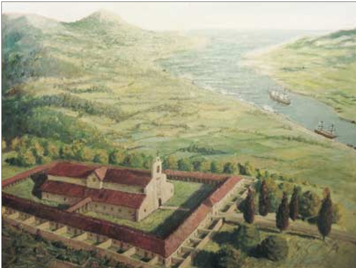
Cuadro del Desierto. Localizado en el desierto carmelita de San José de la Rigada, en Hoz de Anero (Cantabria).

ikusi zuten irautea, eta agintariei lizentzia gehiago ez emateko erregutu zieten.