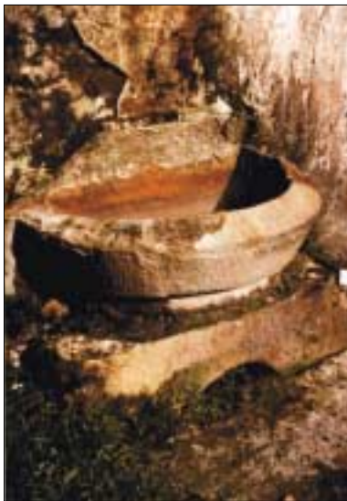
Antigua pila de agua. (Autor: José Ramón Tojal)

Hablo en pasado y con gran pesar, pues he visto fotografías sacadas en 1980 por el entonces párroco de Burceña, D. José Ramón Tojal, donde aparecen las ruinas del monasterio con muros de algo más de un metro de altura y todos los elementos arriba mencionados. En la actualidad queda la fachada de la iglesia que está construida con piedras pertenecientes al monasterio; la pileta de la plaza; el presbiterio de la iglesia, que era la antigua capilla funeraria de los Llano; y alguna pileta que hay en la huerta de la casa que está al lado de la iglesia 5 . Y no queda más, todo el resto ha sido destruido para hacer un estacionamiento de camiones, y parte de las ruinas quedaron dañadas al construir el ferrocarril de La Robla.