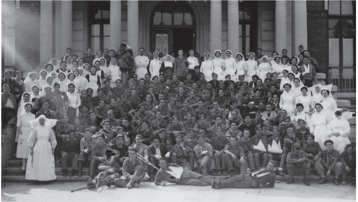
Miranda egoitza, Odol Ospitalea bihurtuta. Guda frontean zauritutako frankistak azaltzen dira.

Agate deunaren eguna ospatzeako arazoak egon ziren gerratea zela eta. Izan ere, abesbatzak arriskuan egon zitezkeen gauean abestera ateratzen baziren, ohikoa zen eran, eskuan tortxak ziztuztela ateratzen baitziren. Gau hartan hegazkin frankistaren bat agertuz gero, argiak ikusi eta euren helburuak errazago tiroratu ahalko lituzkete. Honela, alkateak abesbatzei baimena eman zien kantatzera ateratzeko, baina gaueko hamarrek baino lehen etzean egoteko baldintzapean.