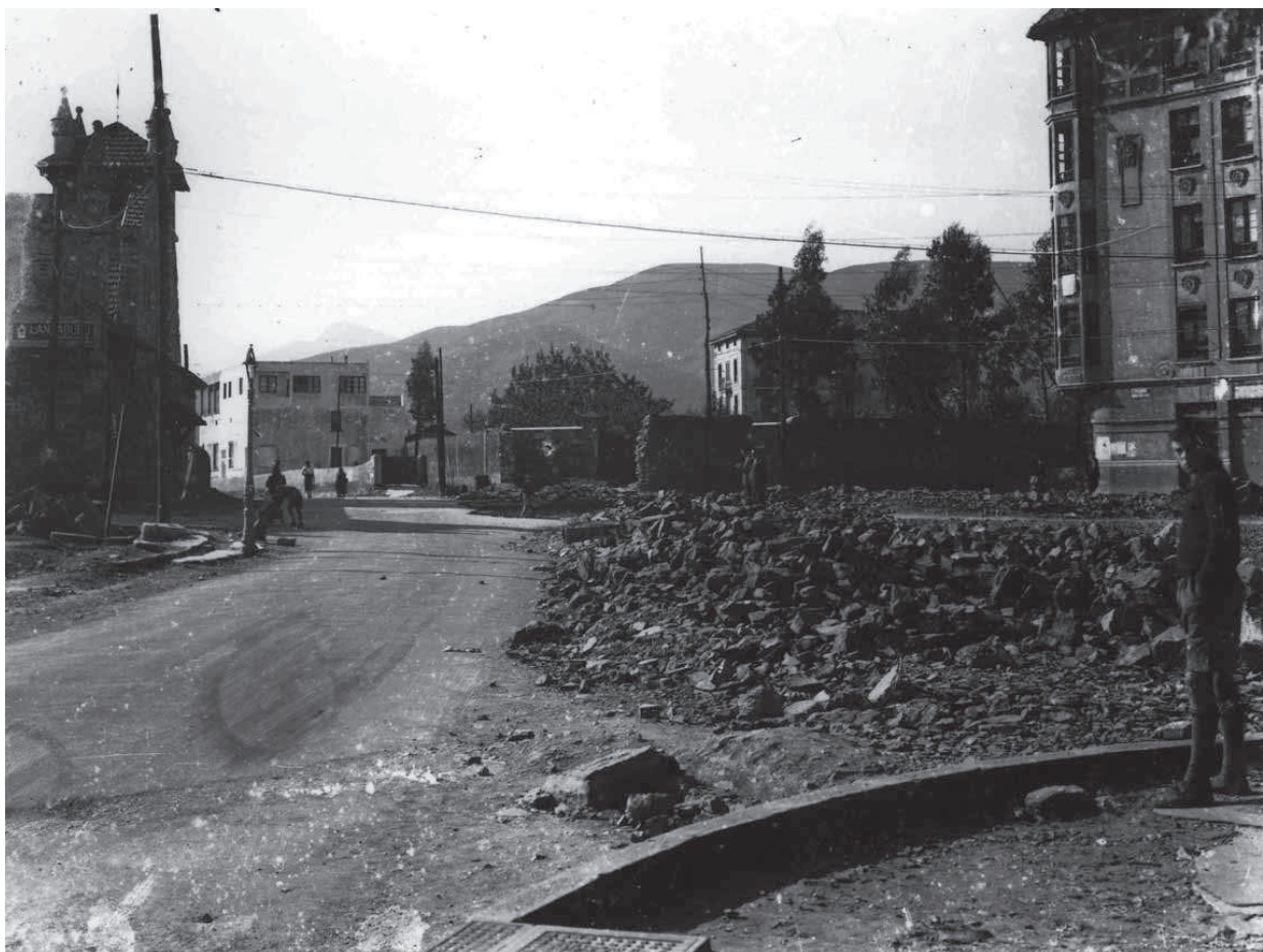
Bide Onera plaza, 1939. Hildako frankisten omenez "Monumentua" eraikitze-lanak hasiak ziren.

Ilu, nahiz eta azken momentuan beharrezkotzat jotzen bazuen, suntsitzeko baimena ere bazuen. Urkulluren eskuetan geratzen zen, beraz, ezkerraldeko industriaren etorkizuna. Honek batailoiko gainontzeko buruzagiekin hitzegin ostean, lantegia italiar Gezi Beltzen eskuetan uztea erabaki zuen, nahiago baitzuten hori lantegiek Frankoren tropen eskuetan bukatzea baino. Italiarrendandik tratu egoki bat jasotzea espero zuten, eta garaile duinak izango zirelakoan zeuden. Frankorengan, ordea, ez zuten halako uste onik, eta porrotaren ondorioak gogorragoak izan zitezkelakoan zeuden. Frankoren mendekuaren beldur ziren bai gudariak eta baita euren buruzagi militar eta politikoak ere.