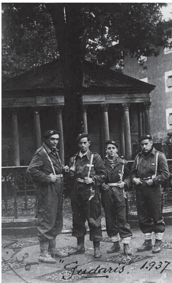
Gudariak Gernikako Arbolaren aurrean.