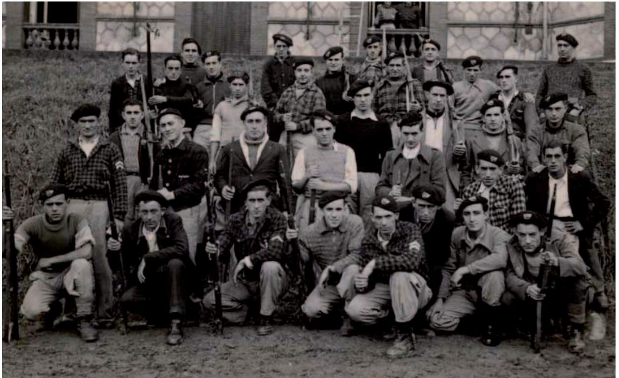
Gordexola Batailoa, 1. Cia- Elgezabal, 1936 (Argazkiko gehienak barakaldarrak dira).

na: "Egun batean trenetik jaisterakoan, arkume bat lortu zuen gizon bat ikusi nuen. Ez zuenez ez arkumea galdu ez zergarik ordaindu nahi, aberea arroparen azpian sartu eta sasi muga pasatzen saiatu zen. Milizianoak konturatu egin ziren, ordea, eta geldiarazi egin zuten. Arkumea konfiskatu zioten, eta esku hutsik joan behar izan zen".