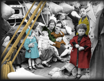
Errefuxiatuen aurpegia. Emakumeak eta haurrak Habana antzinan. El rostro de los refugiados. Mujeres y niños a bordo del Habana.

Palacio y finca fueron adquiridos en 2014 por el Ayuntamiento de Barakaldo.