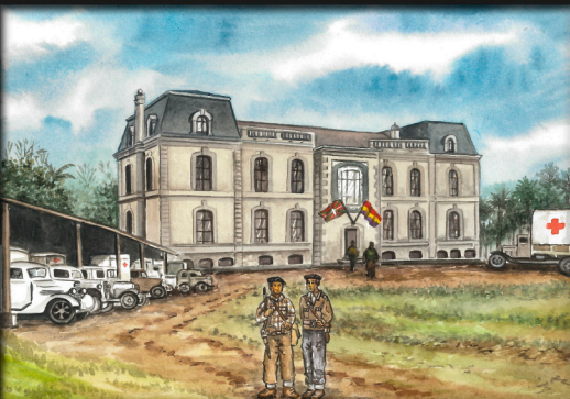
Munoa Jauregiaren birsorkuntza, Gerra Zibilean, matxinatutako armadak Barakaldo hartu aurretik, 1937ko ekainaren 22an. Recreación del Palacio Munoa durante la Guerra Civil antes de la toma de Barakaldo por el ejército sublevado, el 22 de junio de 1937.

El itinerario de la Memoria Histórica de Barakaldo incluye 10 paneles repartidos por los lugares emblemáticos identificados de nuestro municipio en los que acontecieron hechos significativos en relación con la Guerra Civil y la dictadura franquista. Invitamos a realizar el recorrido como incentivador de la recuperación de la memoria histórica. Se pretende contribuir a garantizar los derechos a la verdad, la justicia y la reparación.