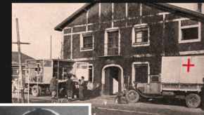
Munoa Jauregiari erantsitako gelak, Odol Ospitale gisa erabiliak. Dependencias anexas al Palacio Munoa utilizadas como Hospital de Sangre.