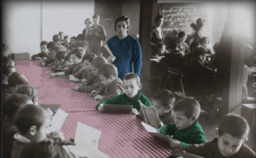
Orthez, Frantzia. Euzkadiak haur-koloniarren ikasgela. Orthez, Francia. Aula de estudio de la colonia infantil de Euzkadi.