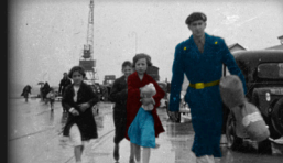
Santurtzi. Ertzainak haurrei ingurutzin ari dira ebakuzazio-ontzietan. Santurtzi. Ertzainak acompañan a los niños/as en el embarque de evacuación.

Con el avance del Ejército golpista y tras la caída de Gipuzkoa el 12 de octubre de 1936, el Palacio Munoa se convirtió también en centro de acogida de refugiados. Su número fue en aumento hasta superar los 4.000. A la mayoría se les alojó después en el Hospital de Rortegi, hasta entonces en desuso.