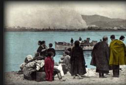
Hendiaia, 1936ko iraila. Irati erori ondoren ihes egin zuten zibilak. Hendaya, setiembre de 1936. Civiles huidos tras la caída de Irati.

Uste denez, Gerra Zibilean 226.000 pertsonak ihes egin zuten Frantziara, eta errefuxiatuentzako esparruetan sartu zituzten, egoera penagarrian. Hilabete batzuk geroago, Alemaniako armadak aldameneko herraldia okupatu zuenean, asko harrapatu, eta nazien kontzentrazio-esparruetan sartu zituzten.