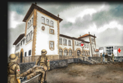
Juan Ignacio Gorostiza Ikastetxearen birsorkuntza. Gerra Zibilean Ospitale bihurtu zuten, fronteian zauritutako soldadutak artatzeko. Gaur egun, Alkartu Kurtsua.

Además del Palacio Munoa, Barakaldo contó, con cinco Hospitales de Sangre, ubicados en el Colegio las Hermanas de La Salle, el Hospital de Altos Hornos de Vizcaya (actual Hospital San Eloy), la Fundación Miranda, el Colegio Juan Ignacio Gorostiza y el Colegio Arteagaebitea.