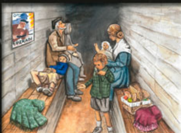
Babesleku baten birbirkonkista Barakaldon. Okupatzaileak erositapen txarrak eta elikagai gutxiak leku hotz eta umetan plazaratzen ziren. Bestigizak, arrosak, guragezatuak eta gisak amaizurak egiten zuzten txarretako ondak.