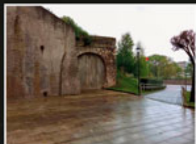
Babesleku antiaereo gisa egokitu zen Franco-Belga de Minas de Somorrostro konpainiaren tunel hormatuaren gaur egungo irudia. Irudia actual del túnel tapado del ferrocarril Bilbao-Portugalete que se habitó como refugio antiaéreo.