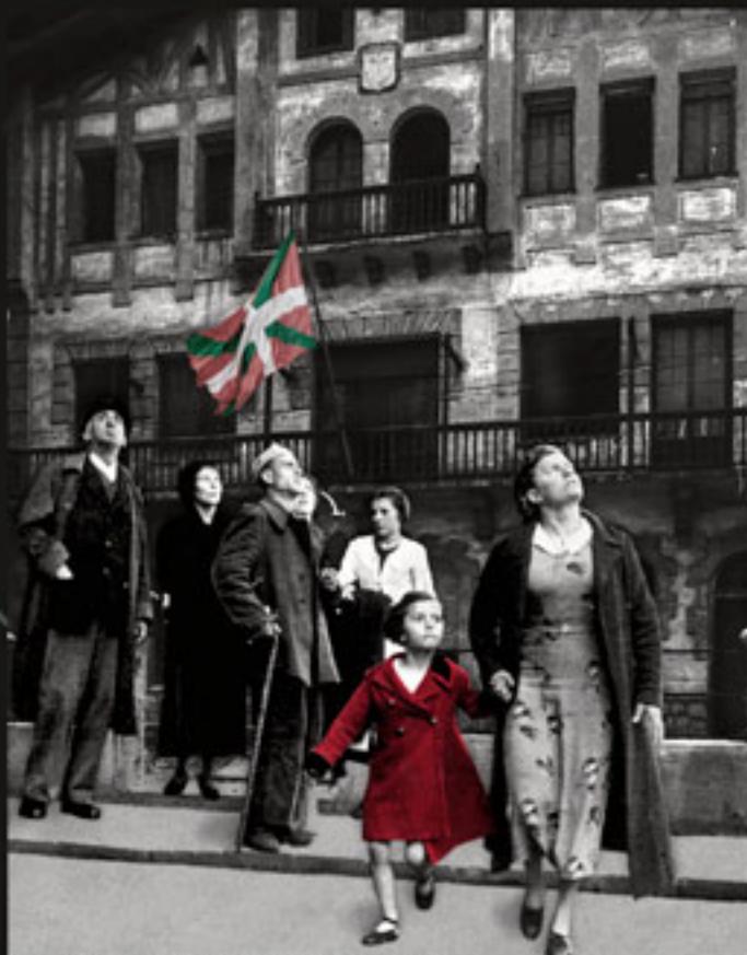
Bombardaketa baten birbirkonkista Foruan Rivaslekuan, Batzokaren ondoan. Reacción de un bombardeo en el Paseo Las Flores, junto al Batzoki.

El itinerario de la Memoria Histórica de Barakaldo incluye 10 paneles repartidos por los lugares emblemáticos identificados de nuestro municipio en los que acontecieron hechos significativos en relación con la Guerra Civil y la dictadura franquista. Invitamos a realizar el recorrido como incentivador de la recuperación de la memoria histórica. Se pretende contribuir a garantizar los derechos a la verdad, la justicia y la reparación.