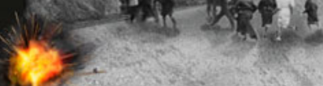
Bombardaketa baten irudia, San Bizente kirati-hiri babeslekuaren birbirkonkista. Herriaren, zututa, babesleku ondoan. Reacción del refugio de la ciudad deportiva de San Vicente en el momento de un bombardeo. La población, alarmada como en busca de protección.