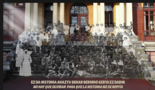
EZ DA HISTORIA ANATUZ BIDERA BERRIRO GERTA EZ DADIN NOHAY QUE OLVIDAR PARA QUE LA HISTORIA SE REPIETA