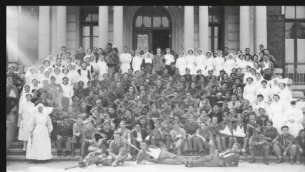
Talde-argaria Miranda Fundazioaren eskualdean. Soldadu errotadak osan-lengilek zigortzeko bako behar die. Fotografía de grupo en los recintos de la Fundación Miranda. Los soldados convalecientes, operarios rotatorios por el personal sanitario.

Algunos centros educativos fueron convertidos en Hospitales de Sangre. Este fue el caso del Colegio Juan Ignacio Gorostiza, actual Instituto Añartu, ya que se dotó de manera urgente de camas y sala de curas, para atender a soldados enfermos o heridos.